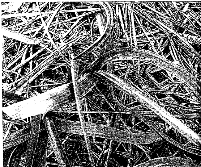
In narcis is zichtbaar virus al snel goed te zien