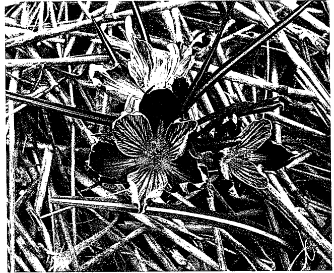
Waaierbont in krokus