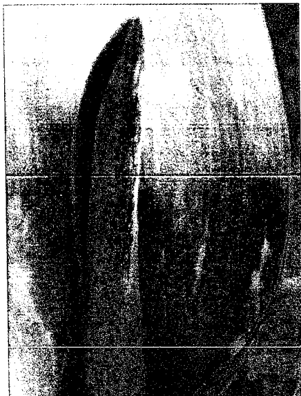
Zo manifesteert TRV zich in de cultivar 'Purissima'