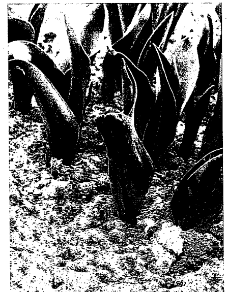
Beelden van TBV in 'Gander'

advies, hetgeen bij kan dragen in het onder controle houden van de virussituatie in de betreffende tulpenkramen. Deze specifieke gegevens bestaan onder andere uit de samenstelling van de kraam, de partijgeschiedenissen, vroege ELISA-uitslagen, cultivargevoeligheden en -bijzonderheden, perceelsinformatie en verspreidingsrisico's. Aan de hand van deze complexe materie kan in overleg met de individuele teler, of wellicht een groep van telers, een plant- en selectieadvies opgemaakt worden. Door een bepaalde plantlocatie en plantvolgorde vast te stellen, kan een scheiding van goede en minder goede partijen gemaakt worden. Tevens kan bepaald worden in welke partijen meer of minder energie ten aanzien van de selectie gestoken dient te worden.