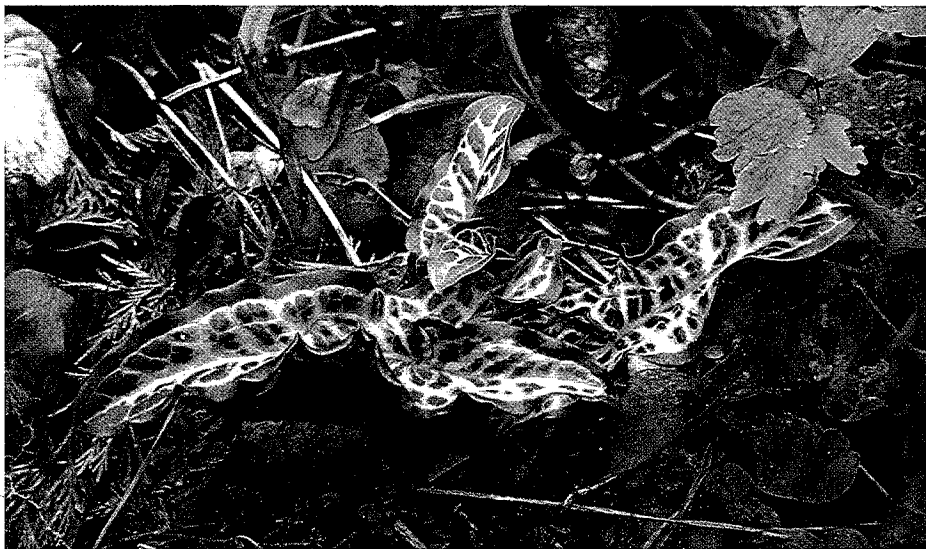
Arum italicum 'Marmoratum'

Van Arum italicum is de subspecies 'Marmoratum' het meest bekend en wordt ook wel aangeduid als Arum marmoratum , dus als apart soort. Arum italicum 'Marmoratum' vormt grote, getekende (gemarmerde) bladeren die bijna rechtop staan. De bladeren van het soort zijn kleiner en bezitten bijna géén tekening. Ook de bloeiwijze, met het rechtopstaande schutblad, is kleiner bij Arum italicum . Het meest opvallend bij beiden is de bloemsteel met de rode bessen. Naast de subspecies 'Marmoratum' zijn de volgende subspecies of variëteiten beschreven: albispatum , 'Chameleon', italicum en neglectum .