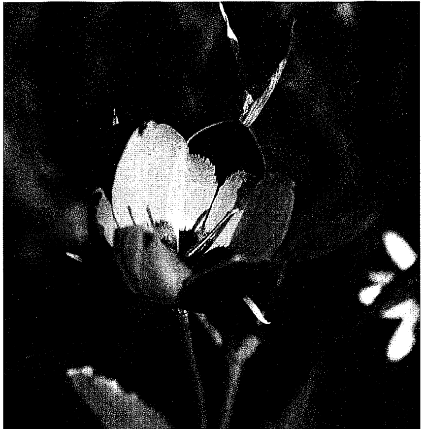
Hesperantha vaginata . Als je een veld vol met bloeiende planten van dit soort ziet, zou je niet geloven dat deze soort op de lijst van bedreigde plantensoorten staat.

bloeien vele verschillende planten op en tussen de rotsen, iets waar dit natuurgebied bekend om is. In het Engels worden de planten, die tus-