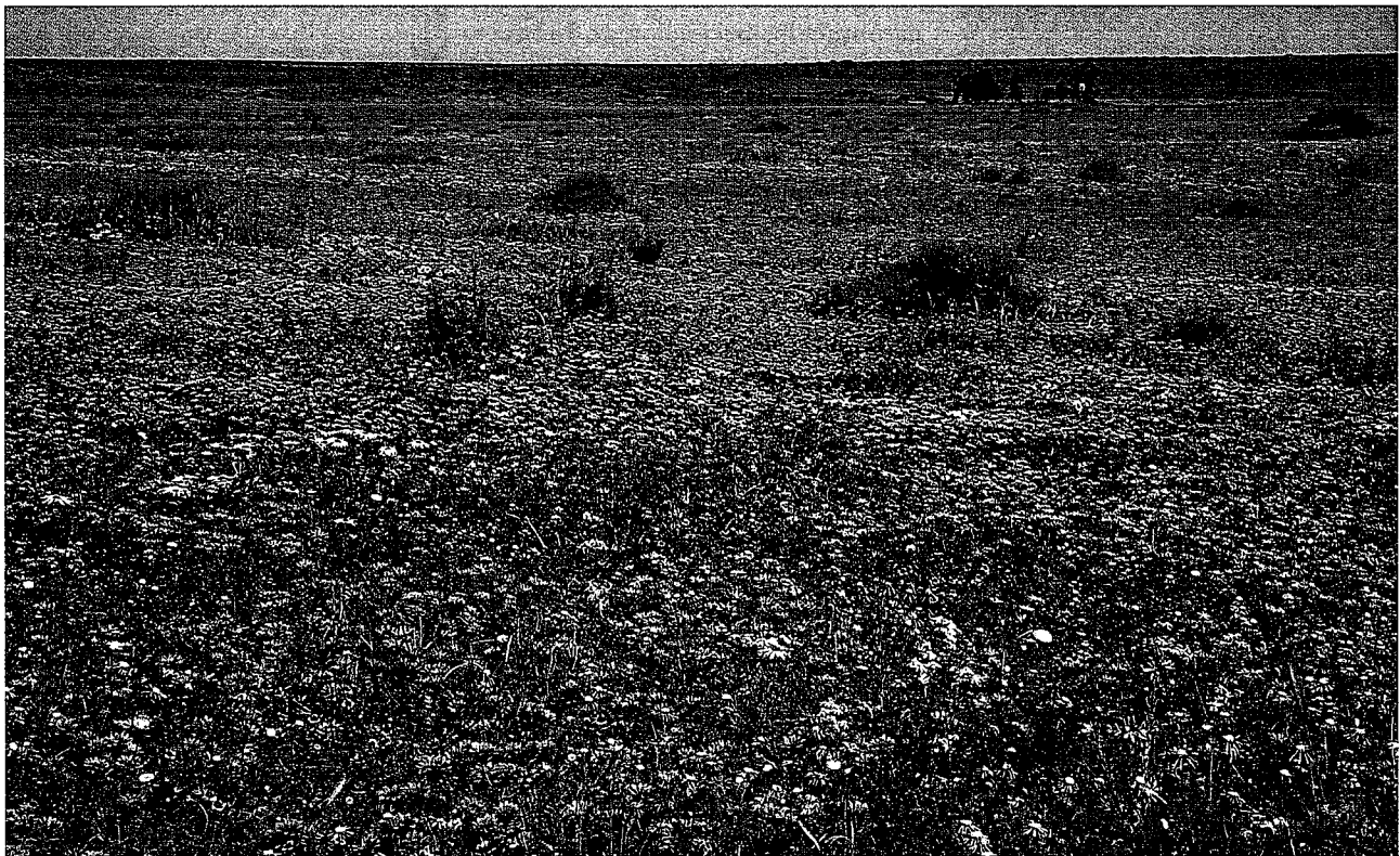
Velden oranje gekleurd door bloeiende Gazania rigida planten.

Voor mij is het natuurgebied 'Oorlogskloof' één van de best bewaarde geheimen van Nieuwoudtville. Er groeien en