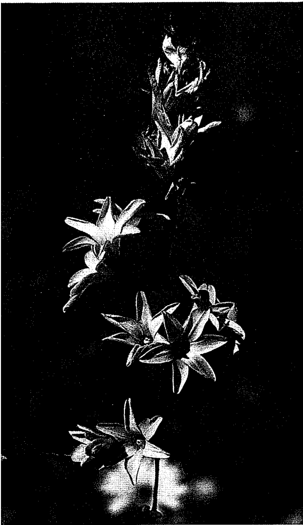
Ixia rapunculoides Nieuwoudtville.