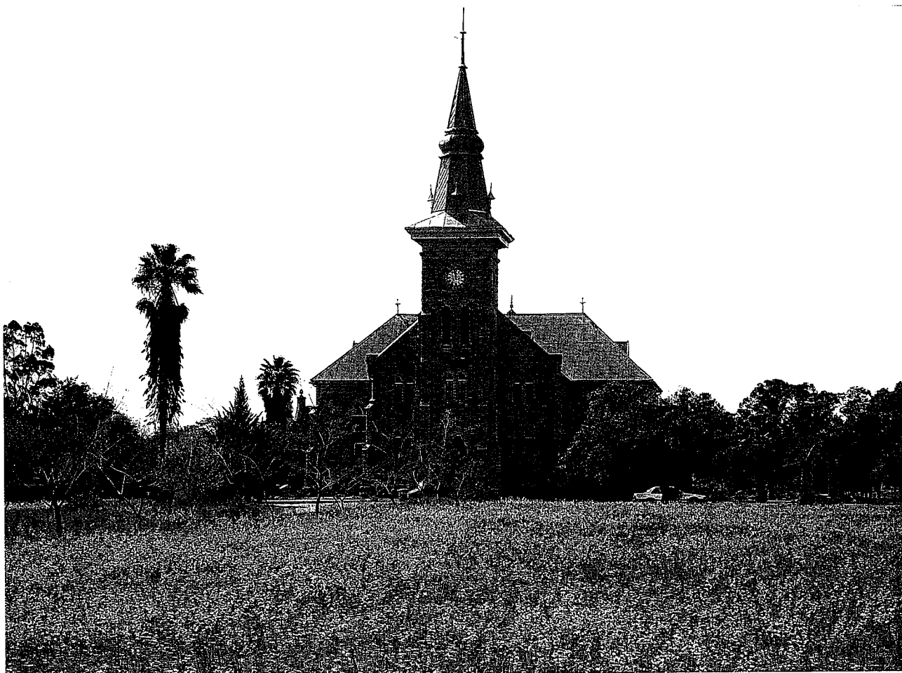
Voor de kerk in het centrum van Nieuwoudtville staan duizenden Ixia rapunculoides planten in bloei. Het is één paarse deken.