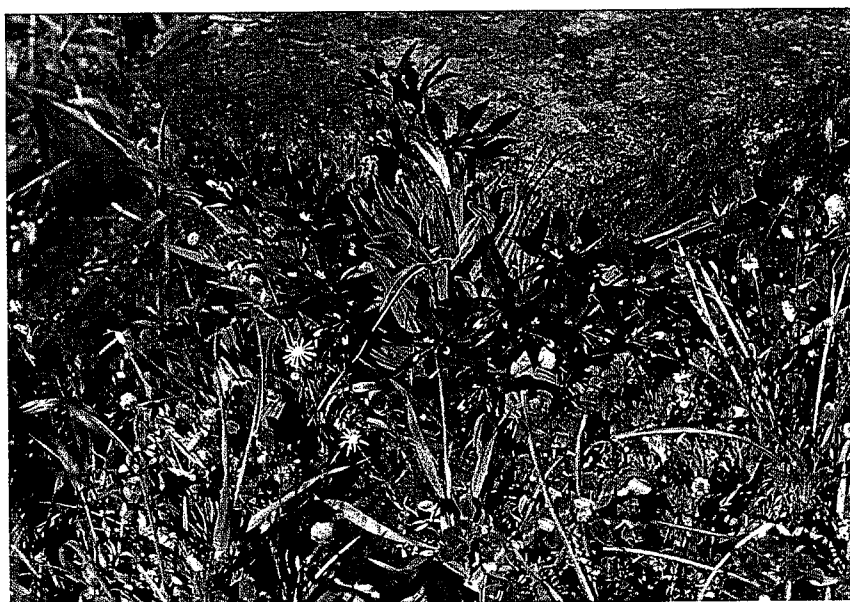
Babiana framesii .

Nieuwoudtville is een klein plaatsje met nog geen duizend inwoners in het zuiden van de Zuid-Afrikaanse provincie Noord-Kaap. Om de plaats vanuit Kaapstad te bereiken rijd je over de N7 naar het noorden. Bij Vanrhijnsdorp rijd je via het zuidelijk deel van de Knersvlakte naar de Vanrhijnsplas.