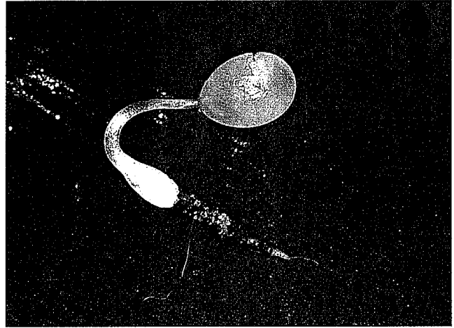
Haemanthus albiflos zaad met jonge bol

In de periode na het delen van de bol, de eigenlijke rustperiode, zullen nieuwe bolletjes worden gevormd, die na vorming in rust gaan. Pas aan het begin van het groeiseizoen zullen ze uitlopen en hun bladeren boven de grond laten zien, het is de eigenlijke rustperiode van de bol, maak de grond daarom niet te nat en plaats de potten met de bollen bij een temperatuur, die overeenkomt met de overwintertemperatuur van de bol. Haal na afloop van het eerste groeiseizoen de bollen uit de grond, laat ze een tijdje drogen en verwijder de oude, verdroogde boldelen.