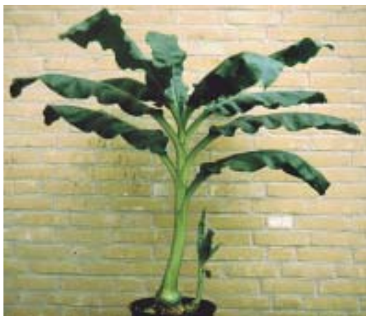
Plant Scadoxus multiflorus ssp. katherinae

Tot 1976 werd het geslacht Scadoxus tot Haemanthus gerekend. In dat jaar verscheen van de hand van Friis en Nordal het vierde en laatste artikel uit de serie 'Studies on the genus Haemanthus ( Amaryllidaceae )' onder de naam 'Division of the genus into Haemanthus s.str. and Scadoxus with notes on Haemanthus s.str.'. In dit artikel komen de auteurs tot een afsplitsing van Scadoxus van Haemanthus op basis van morfologische eigenschappen en verspreidingsgebied. De morfologische verschillen tussen de twee geslachten betreffen met name het type bol, de bladeren en de bloeiwijze.