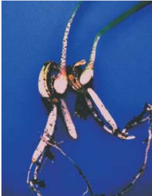
Parten Haemanthus coccineus met nieuwgevormde planten

het aantal planten door zaailingen beperkt. H. nortieri is niet de enige plant die in zijn voortbestaan wordt bedreigd. Bij een ander bolgewas, Daubenya aurea , is hier een stokje voor gestoken. Deze plant heeft een klein groeigebied in de omgeving van de plaats Middelpos. Net als bij H. nortieri wordt het groeigebied(je) als weidegrond gebruikt en de planten worden door de grazende schapen opgevreten of vertrapt. The Indigenous Bulb Association of South Africa (IBSA) besloot in 1997 een deel van het groeigebied te onttrekken aan het veeteeltgebruik en het te gaan beschermen (Saunders, 2000). In samenwerking met de landeigenaar en het Wereld Natuur Fonds heeft de IBSA een deel van de groeiplaats gekocht en er letterlijk een hek omheen gezet. Dat kon vrij makkelijk, het gaat om een stuk grond van 100 bij 50 meter. Niet groot, maar wel het belangrijkste groeigebied van de plant.