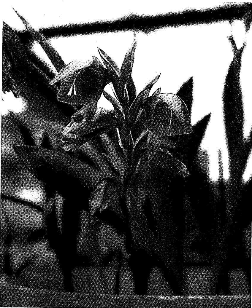
Boven, Gladiolus equitans , onder Gladiolus elatus , (beide Kirstenbosch Botanical garden, Kaapstad )