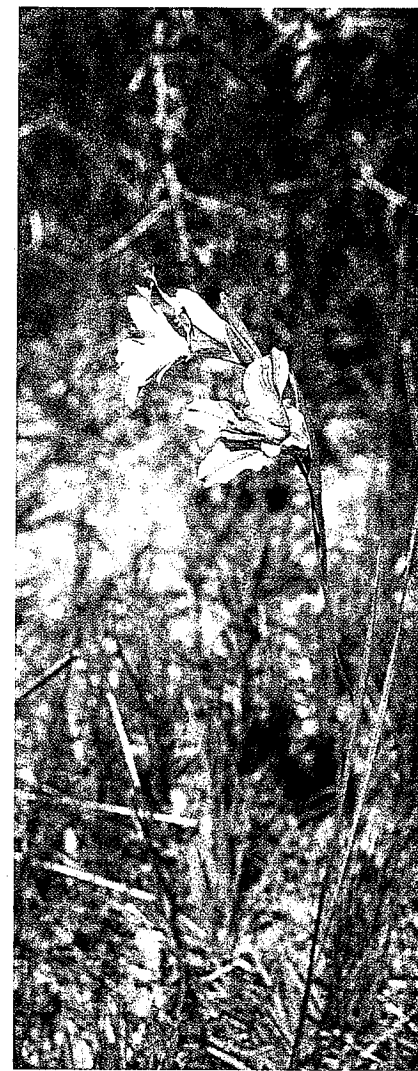
Gladiolus caryophyllaceus (Oude Pos Farm, Darling)

De bloemen van de wintergroeiende Gladiolus caryophyllaceus vertonen wat betreft vorm enige overeenkomst met 'onze' gladiolen. Hij houdt het midden tussen een groot- en een kleinbloemige. De bloemen zijn bijna geheel effen paars van kleur, de keel heeft nauwelijks of géén aparte tekening. De kleur paars kom je in het Nederlandse assortiment niet tegen. Naast de kleur heeft deze gladiool nog iets bijzonders. De bloemen van Gladiolus caryophyllaceus versprei-