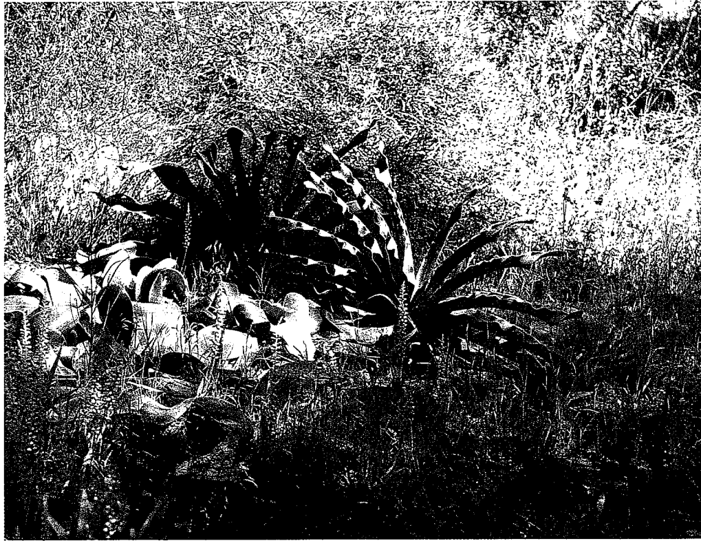
Boophone disticha (Ramskop Wild Flower Reserve, Clanwilliam, Zuid-Afrika)

Nederland zoals bij het geslacht Gethyllis . In hun thuisland Zuid-Afrika zijn Gethyllis soorten makkelijk te kweken. In Nederland behoren ze tot één van de moeilijkst te kweken bolgewassen. Ze groeien nauwelijks, rotten makkelijk weg en bloeien, ho maar. Rest ons weer alleen het blad. Bij de meeste soorten groeien de bladeren rechtop en