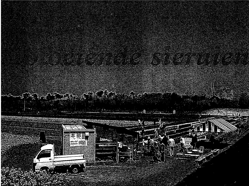
Het Tulip Flower Festival in Nakajo, waar bezoekers tussen de tulpen mogen lopen

krusingen de verzamelnaam Autumn Violet gekregen. Deze paarsbloeiende Autumn Violet is steriel en geurt niet. In Japan bloeit Autumn Violet, net als de beide kruisingsouders in oktober-november. Qua bloeiwijze en bloemen heeft Autumn Violet wel wat weg van aflatanunse en 'Purple Sensation'.