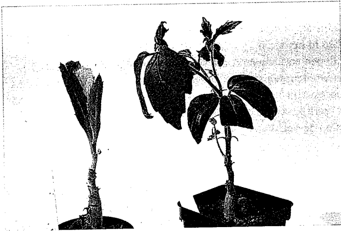
Cyphostemma bainesii en Cyphostemma sandersonii

dex, waaruit lange, slingerende of liggende, veelal éénjarige stengels ontspruiten. Dat ik in dit artikel geen aandacht aan deze familie besteed, komt omdat ik geen ervaring heb met deze familie.