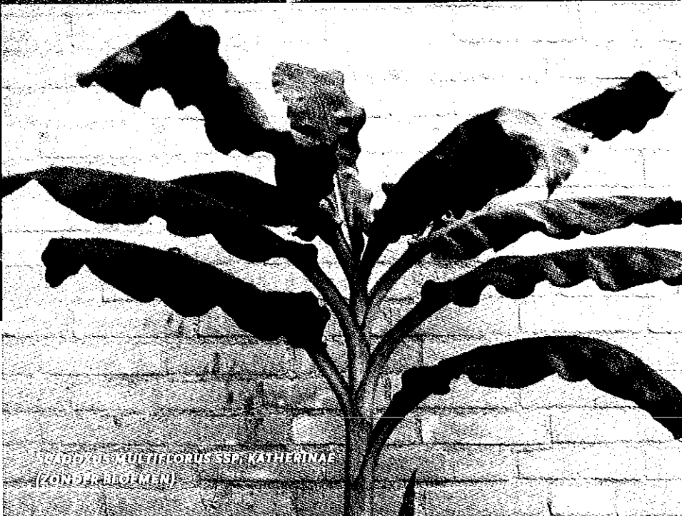
SCADOXUS MULTIFLORUS SPP. KATHERINAE (ZONDER BLOEMEN)