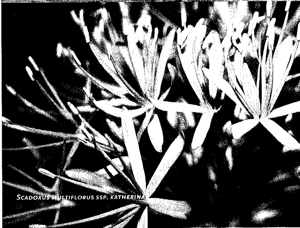
SCADOXUS MULTIFLORUS SPP. KATHERINAE

Wie Scadoxus puniceus in bloei ziet, ziet de gelijkennis met Haemanthus . De zogenaamde bracteeën, die de bloemen omhullen voor de bloei, verdrogen niet en zijn duidelijk aanwezig. Ze staan rechtop en omhullen de bloemen. Deze komen niet boven de bracteeën uit. Het geheel ziet er, met enige fantasie, uit als een kwast. Scadoxus puniceus moet net als de hiervoor genoemde Scadoxus multiflorus ssp. katherinae warm worden gekweekt.