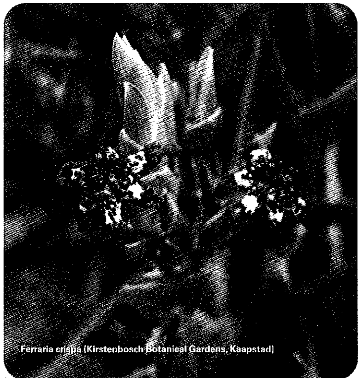
Ferraria crispata (Kirstenbosch Botanical Gardens, Kaapstad)