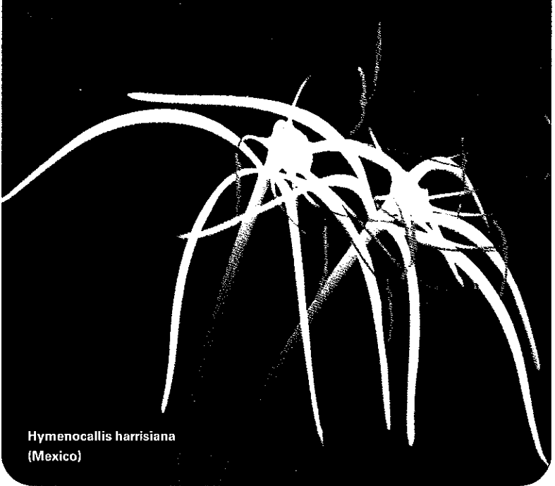
Hymenocallis harrisiana (Mexico)

kleurtekeningen, en bloembladen bezet met stippen of vlekken. De kleuren variëren van wit, geel, groen, blauwgroen tot bruin.