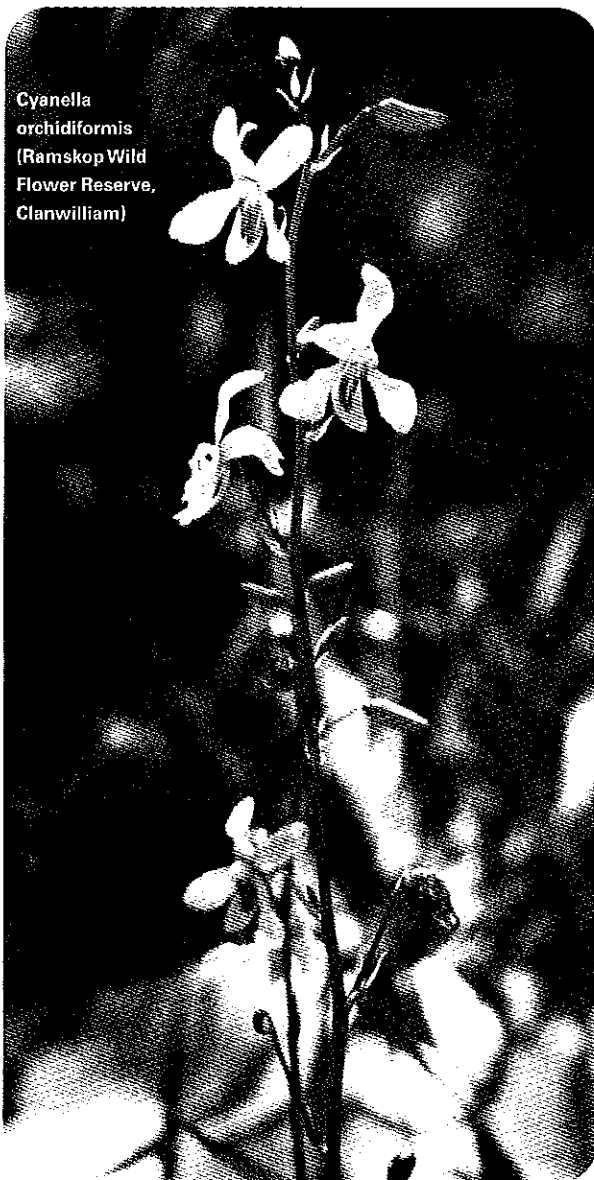
Cyanella orchidiformis (Ramskop Wild Flower Reserve, Clanwilliam)